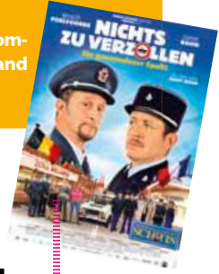
Exklusive Vorpremiere: „Nichts zu verzollen“